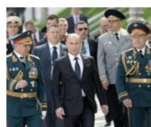
Putin smijenio 15 generala