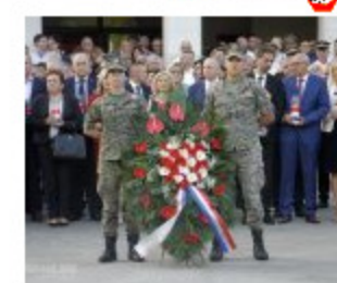
MOSTAR PROSLAVIO 25. OBLJETNICU UTEMELJENJA HR-HB Bez Herceg-Bosne Hrvata u BiH nebi ni bilo

Pravila ponašanja na Poskok.info litiiga po stranijski Disclaimer