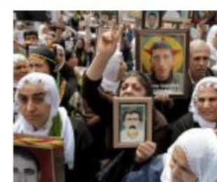
ERDOGAN SUZAVCEM NA MAJKE Zabranio im prosvjede nakon više od 20 godina