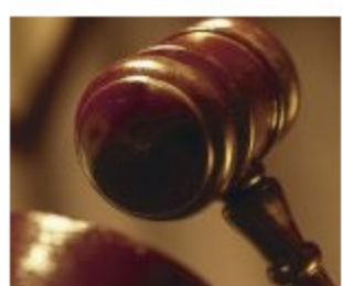
Vojnici Armije RBiH osuđeni za udruženi zločinački pothvat