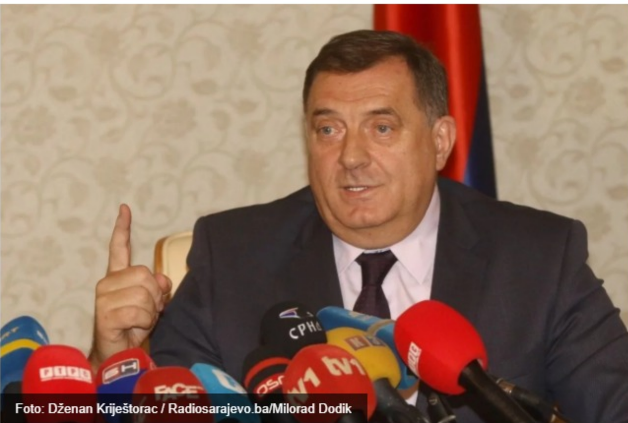
Milorad Dodik