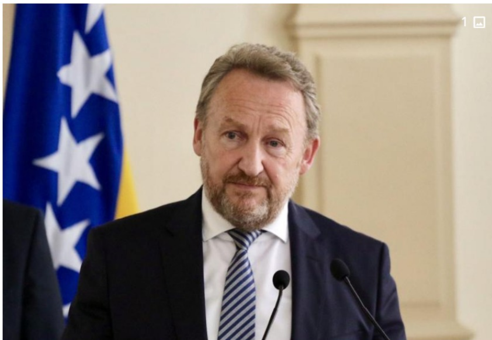
Bakir Izetbegović

Vijesti / Politika | 07. 06. 2018. u 12:22