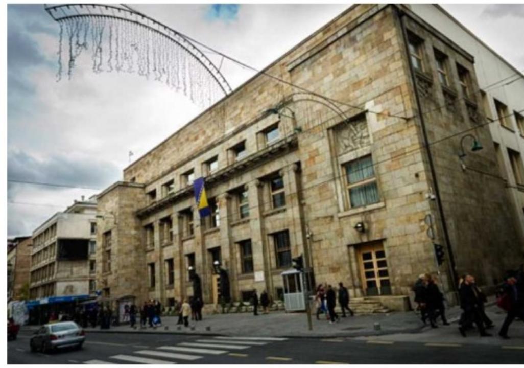
Zgrada Centralne banke u Sarajevu

Pripadnici Državne agencije za istrage i zaštitu (SIPA) zatražili su od Uprave Centralne banke BiH u Sarajevu da im se dostavi određena dokumentacija vezana za imenovanje šefa sigurnosti u ovoj instituciji. Po nalogu SIPA-e Uprava je dostavila tražene dokumente.