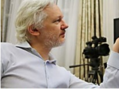
Asanž otkrio ko stoji iza Hilari Klinton (video)