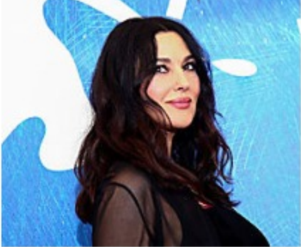
Monika Beluči u 52. godini potpuno naga (foto)