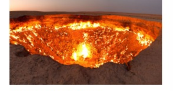
Ovo treba da se vidi! Osam najspektakularnijih provalija na planeti (foto)