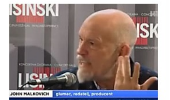
Ja Hrvat? Džon Malkovič otkrio istinu o svom poreklu