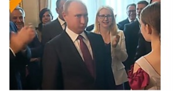
Putina u Beču sačekalo neobično iznenađenje, njegova reakcija sve govori (video)