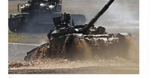
Šta „Biznis insajder“ vidi kao najstrašnije rusko oružje