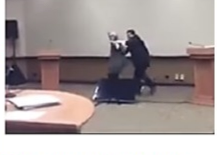
Tajni snimak Hilari Klinton (video)