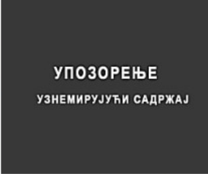
Užasan prizor iz Mosula nakon američkog oslobođenja (video)