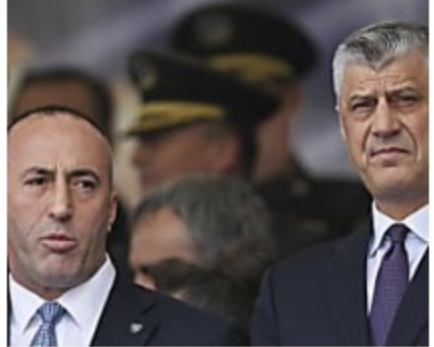
Haradinaj upozorava Tačija: Ne diraj granice — uzećemo Dolinu rado, ako...