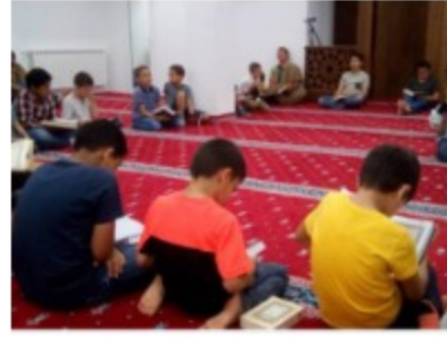
Beograd - Nakon 100 godina, prva halka Kur'ana za djecu (Foto)