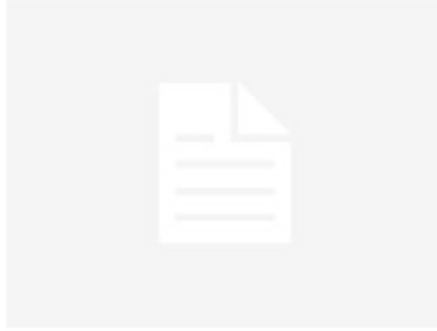
Pet razlika između Sandžaka i Republike Srpske