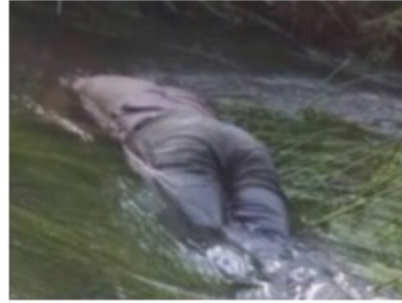
SUBHANALLAH PA I OVO JE NEČIJE DIJETE, I MI SMO BILI U OVAKOJ SITUACIJI : IZBJEGLICA SE UTOPIO U KORANI KOD CAZINA