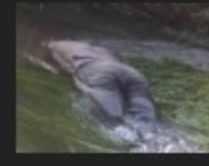
SUBHANALLAH PA I OVO JE NEČIJE DIJETE, I MI SMO BILI... May 21, 2018