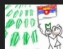
Šestogodišnjak iz RS sreću ilustrirao crtežom sa srpskom zastavom pored srebreničkih... May 21, 2018