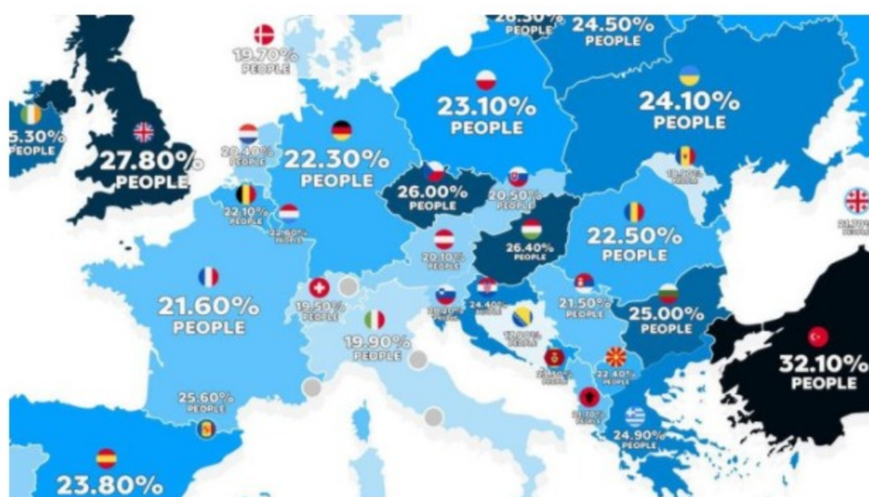
Mapa gojaznosti

Istraživanje Svjetske zdravstvene organizacije pokazalo je da su stanovnici Bosne i Hercegovine najjamnije gojazan narod na svijetu, s obzirom da je istraživanje Svjetske zdravstvene organizacije pokazalo da probleme sa kilogramima ima tek 17,9 odsto stanovništva te zemlje.