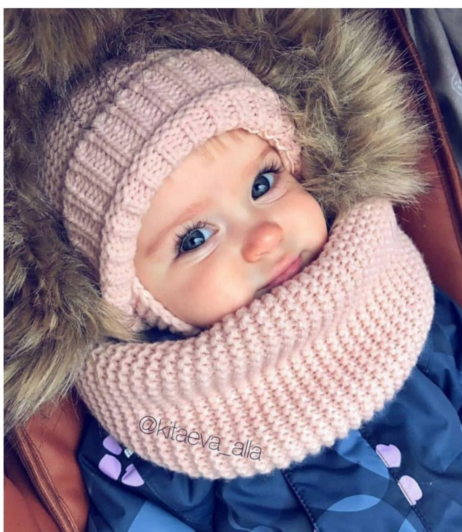
Mali anđeo prije svog nasilja od majke,policija bi trebala poduzeti sve mjere da smjeste majku u pritvor na dugo vremena.

← ISPOVEST! Spavao Sam Sa Mamom Od Djevojke ..