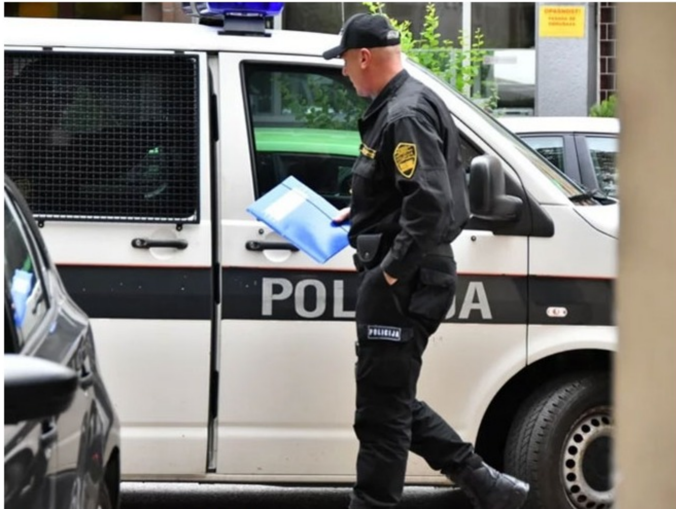
Federalna uprava policije

Na sastanku juče u Sarajevu, kojem su, osim predstavnika agencija za provođenje zakona na nivou BiH, prisustvovali Zvizdić, Mektić i Šarović, vršen je žestok pritisak na Galića da počne sa primjenom pravilnika koji je lično donio Mektić, a koji predviđa upućivanje predstavnika drugih policijskih agencija u BiH u odbranu istočne granice BiH kao ispomoć Graničnoj policiji BiH, navodi ova televizija.