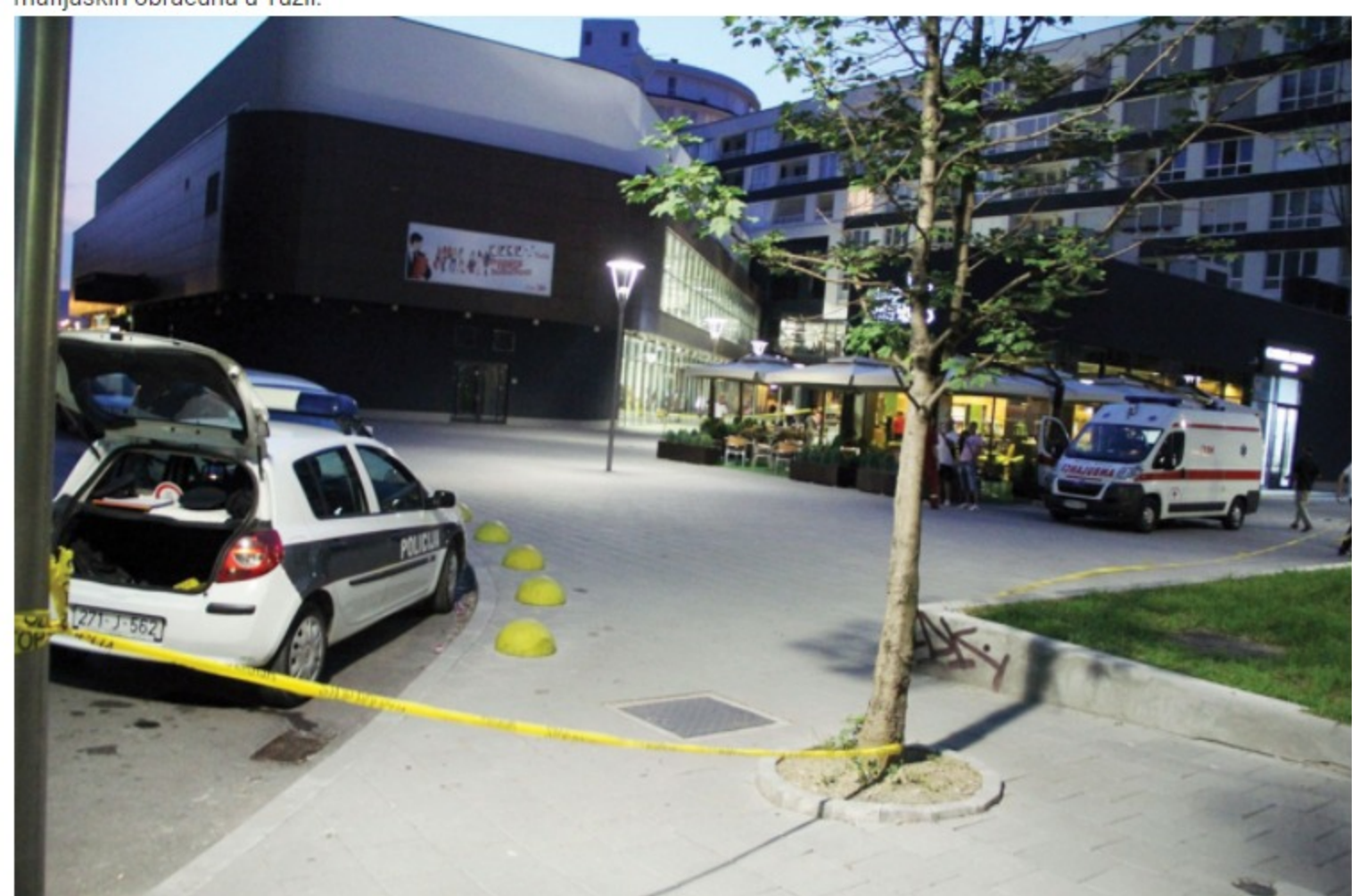
Pucnjava kod Titanika u kojoj je ubijen Džinić

Podsjetimo, Džinić je ubijen u vatrenom okršaju koji se dogodio 22. juna 2013. godine i jedan je od najvećih poslijeratnih mafijaških obračuna u Tuzli.