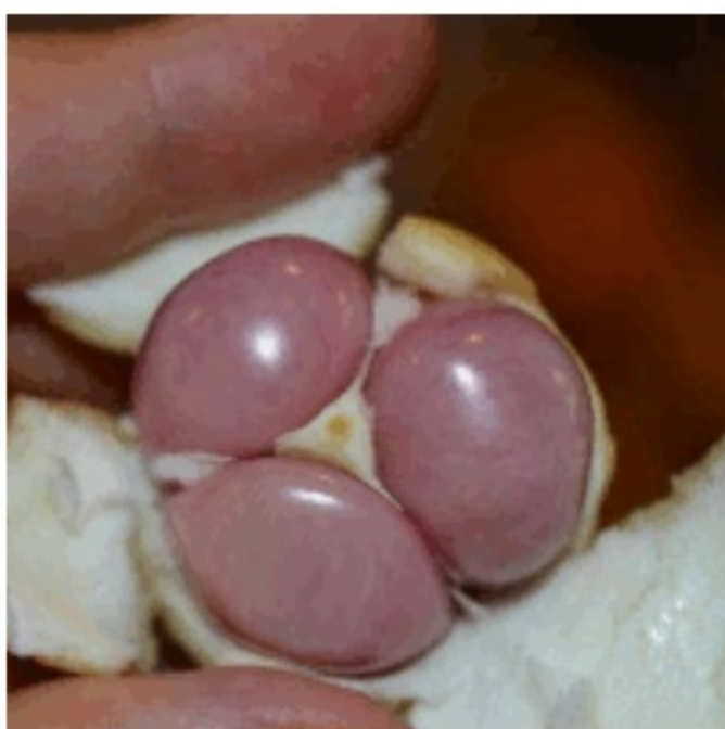
Svi paraziti će nestati iz tijela već sutradan! Samo trebate...

Nije dobro ukinuti takse prije nego što Srbija prizna Kosovo, ocjenjuje Haradinaj i dodaje da "nije slučajno što ga je pozvao Specijalni sud".