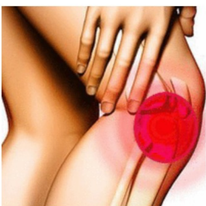
Bol u leđima i zglobovima će proći za 5 dana. Samo svaku večer...