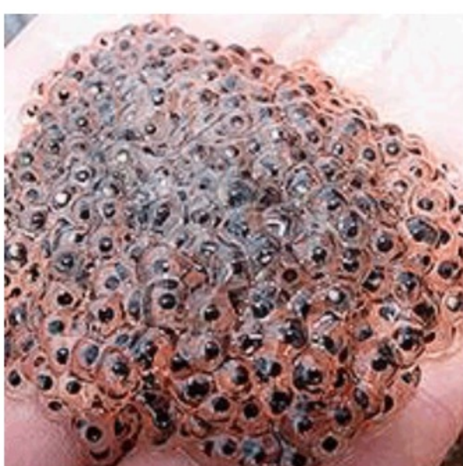
Sve su češći slučajevi smrti od stomačnih parazita!Doktori savjetuju...